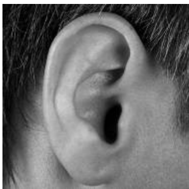
Du hast mir zugehört

Eine oft gehörte und geäußerte Bitte lautet: "Hab doch einmal etwas Zeit für mich!"; "Ich bin so allein!"; "Niemand hört mir zu!" Die Hektik des modernen Lebens, die Ökonomisierung von Pflege und Sozialleistungen zwingt zu möglichst schnellem und effektivem Handeln. Es fehlt oft – gegen den Willen der Hilfeleistenden – die Zeit, einem anderen einfach einmal zuzuhören. Zeit haben, zuhören können – ein Werk der Barmherzigkeit, paradoxerweise gerade im Zeitalter technischer Perfektion so dringlich wie nie zuvor!*