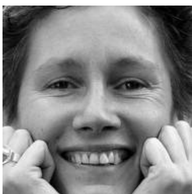
Du gehörst dazu

Norbert Bach, Fotograf und Grafiker, hat das Tuch gestaltet, das uns einlädt, mit uns selbst, mit unserem Nächsten und mit Gott in Berührung zu kommen. In den Fastenpredigten jeweils am Sonntagabend um 18.30 Uhr soll das Fastentuch Thema sein.