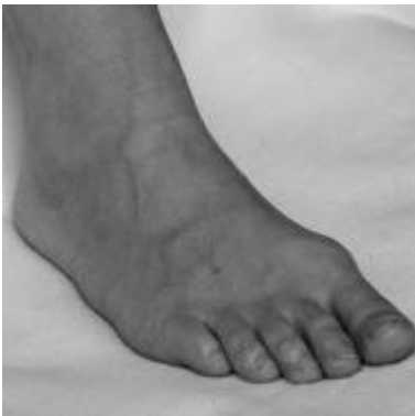
Du bist ein Stück mit mir gegangen

Vielen ist mit einem guten Rat allein nicht geholfen. Es bedarf in der komplizierten Welt von heute oft einer Anfangshilfe, gleichsam eines Mitgehens der ersten Schritte, bis der andere Mut und Kraft hat, allein weiterzugehen. Das Signal dieses Werkes der Barmherzigkeit lautet: "Du schaffst das! Komm, ich helfe dir beim Anfangen!" Unsere Sozialarbeiter der Caritas wissen, wovon ich rede.