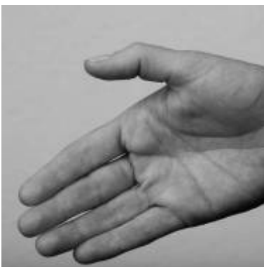
Du hast mit mir geteilt

Es wird auch in Zukunft keine vollkommene Gerechtigkeit auf Erden geben. Es braucht Hilfe für jene, die sich selbst nicht helfen können. Das Teilen von Geld und Gaben, von Möglichkeiten und Chancen wird in einer Welt noch so perfekter Fürsorge notwendig bleiben. Ebenso gewinnt die alte Spruchweisheit gerade angesichts wachsender gesellschaftlicher Anonymität neues Gewicht: "Geteiltes Leid ist halbes Leid, geteilte Freude ist doppelte Freude!"*