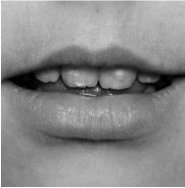
Du hast gut über mich geredet

Jeder hat das schon selbst erfahren: In einem Gespräch, einer Sitzung, einer Besprechung – da gibt es Leute, die zunächst einmal das Gute und Positive am anderen, an einem Sachverhalt, an einer Herausforderung sehen. Natürlich: Man muss auch manchmal den Finger auf Wunden legen, Kritik üben und Widerstand anmelden. Was heute freilich oft fehlt, ist die Hochschätzung des anderen, ein grundsätzliches Wohlwollen für ihn und seine Anliegen und die Achtung seiner Person. Gut über den anderen reden – ob nicht auch Kirchenkritiker manchmal barmherziger sein könnten?*