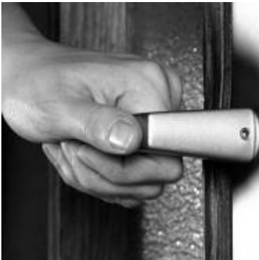
Du hast mich besucht

Meine Erfahrung ist: Den anderen in seinem Zuhause aufsuchen ist besser, als darauf warten, dass er zu mir kommt. Der Besuch schafft Gemeinschaft. Er holt den anderen dort ab, wo er sich sicher und stark fühlt. Die Besuchskultur in unseren Pfarrgemeinden ist sehr kostbar. Lassen wir sie nicht abreißen! Gehen wir auch auf jene zu, die nicht zu uns gehören. Sie gehören Gott, das sollte uns genügen.*